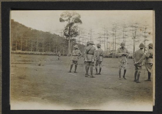
Remise de décorations à Kilosa C. A. A. le 5. 9. 1917.