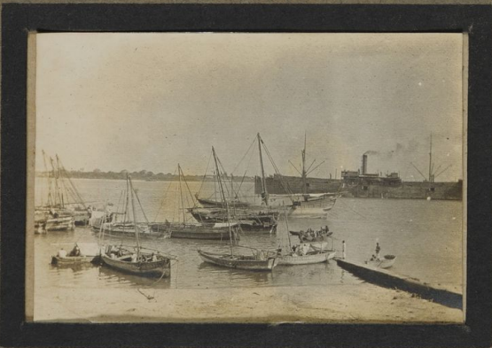
Le port de Dar Es Salaam C. A. A. le 23. 1. 1918