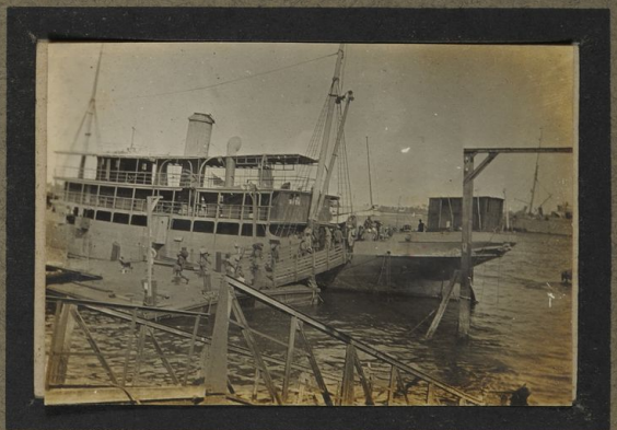
Le port de Dar. Es. Salaam C. A. A. Le 23. 1. 1918.