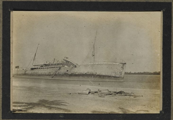
Navire échoué fermant le port Dar. Es. Salaam le 23-1-1918