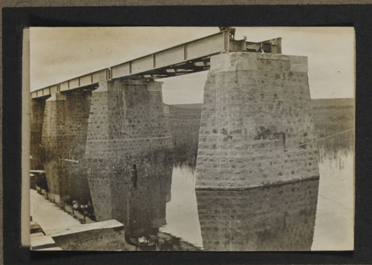
Un pont sur la Malagarasi. E. A. A. Le 7. 5. 1918