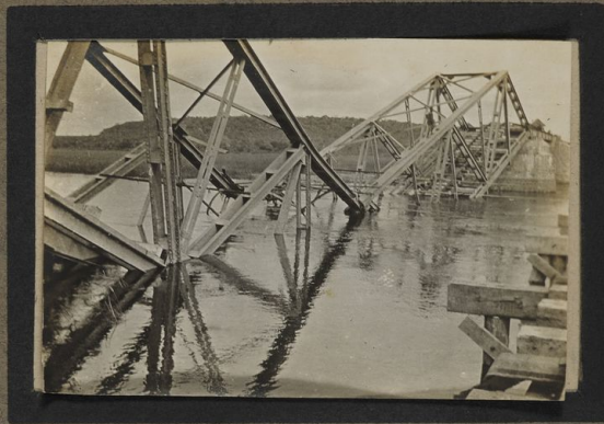
Un pont sur la Malagarasi E. A. A. Le 7. 5. 1917