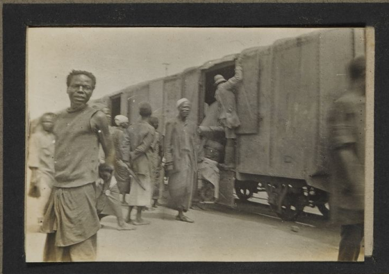
Voyageurs noirs Kilosa C. A. A. le 3. 9. 1917