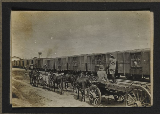
Dodoma, attelage ind. africain six mules. Le 24. 8. 1917