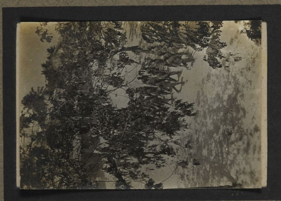
Soldats Allemands prisonniers à Dar Es Salaam E. A. A 27.1.1918