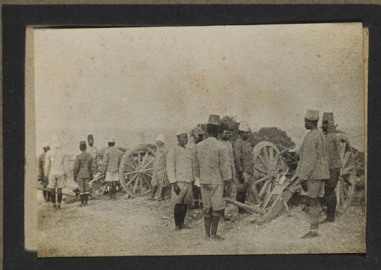
La défense du lac Tanganyika Albertville le 15. 4. 1918.