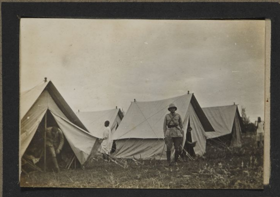
Camp Européen à Kisumu C. A. A. le 17. 12. 1916