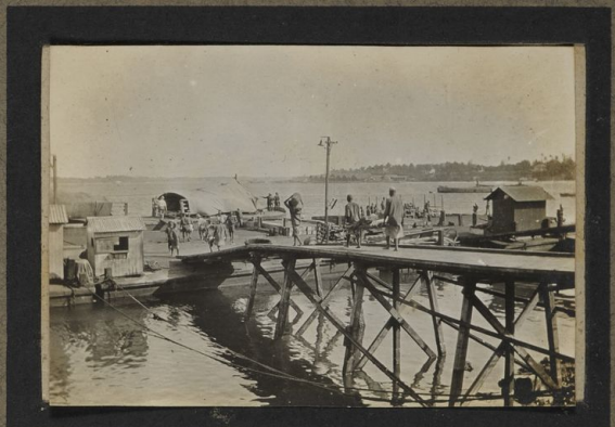
Transport de 5000 soldats anglais vers Le Cap Dar es Salaam C. A. A. le 28. 1. 1918