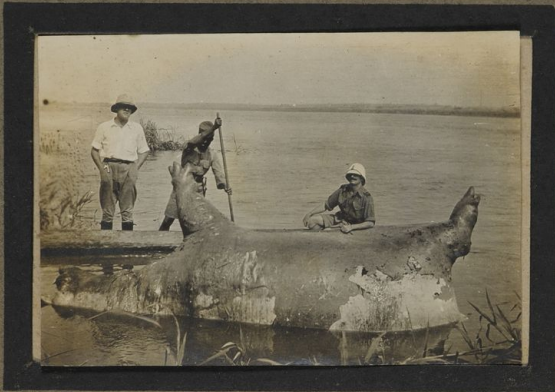
Hippopotame tué par les soldats retrouvé 15 jours après à Kassoungou C. B. le 21-5-1918