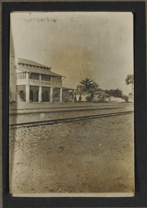
Gare de la Malagarasi Le 7. 2. 1918.