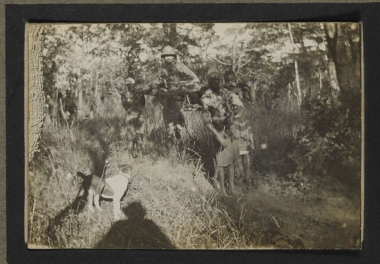
Aux environs d'Ipolé Le 30-4.1917