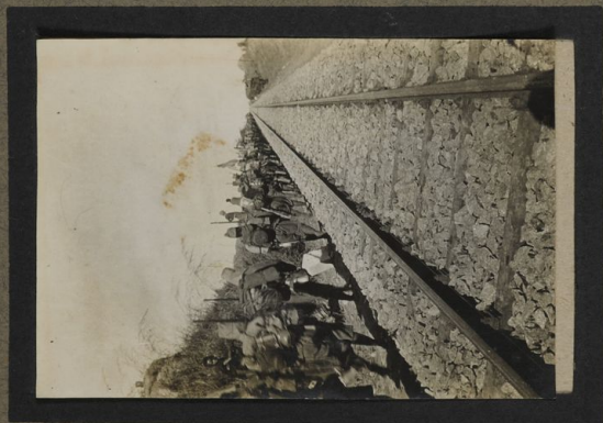
En marche vers Ipolé Le 2-5.1917