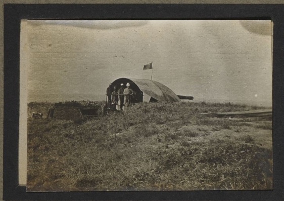
La défense du lac Tanganyika Albertville, le 15. 4. 1918.