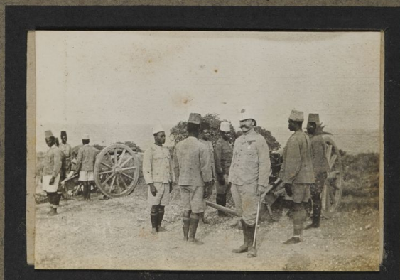
La défense du Lac Tanganyica Albertville le 15. 4. 1918.