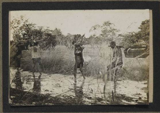
Transport de bagages vers Ipolé Le 30.4.1917