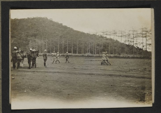
Remise de décorations à Kilosa le 5. 9. 1917