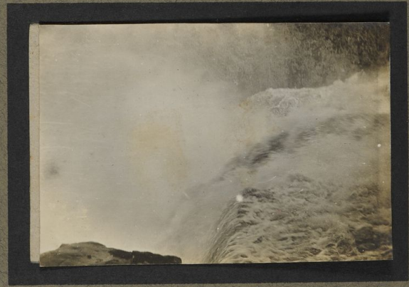
Chutes de la T'chofo