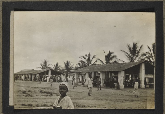
Marché à Tabora