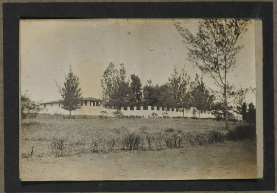
La forteresse d'Udjidji & a a Le 3. 8. 1918.