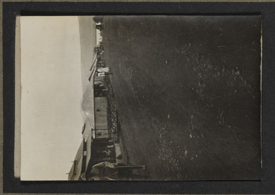
Une vue à Kissimui 25 - 12 - 1916