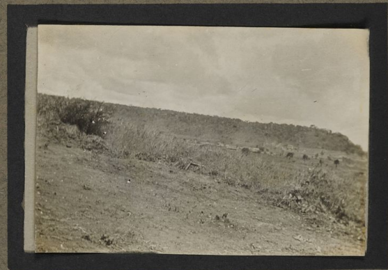
Aspect de la petite brousse