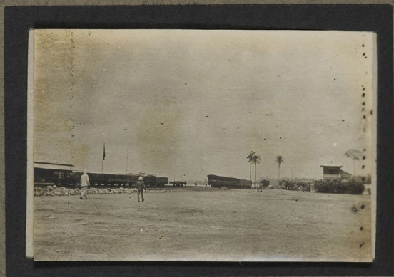
La gare de Kintu