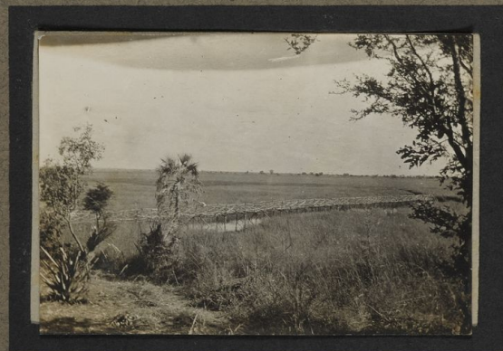
Pont sur les marais de la Malagacasi