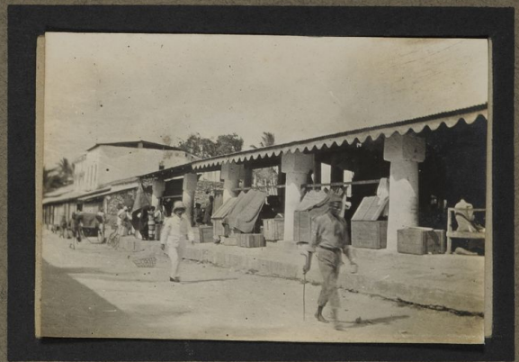
Marché de Doué Es Saloam