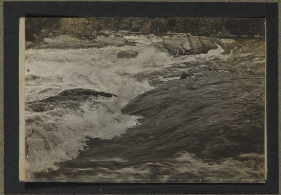
Chutes de la T'chofo