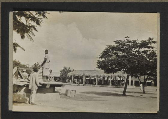
Marché de Dodoma