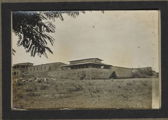
La forteresse de Tabora & a a Le 2. 5. 1917