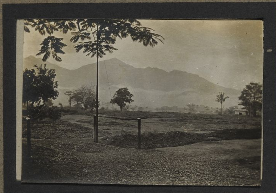
Pont sur les marais de la Malagacasi