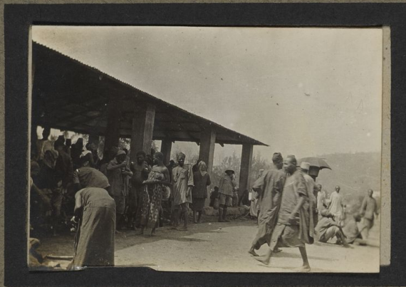
Marché de Kilosa