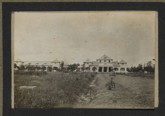
Kaiserhof à Tabora