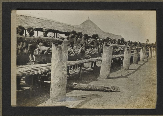
Le Marché de Kongolo C.B.