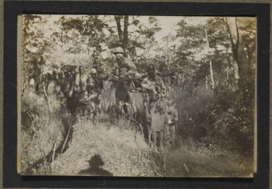
En chaise à porteurs