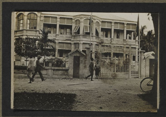
Palais du vice-Gouverneur Stanleyville C.B.