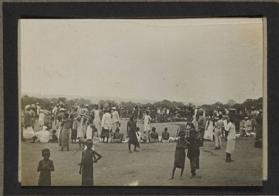
Marché de Kassongo.