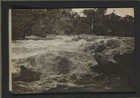
Chutes de la T'chofo