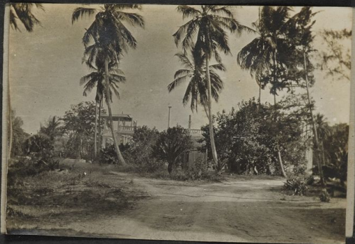
Palais du Gouverneur E. A. A. Démoli par les navires Anglais