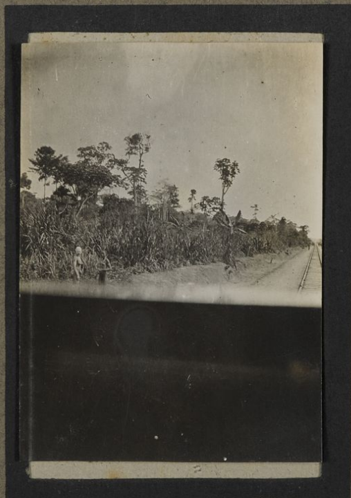
Culture de manioc