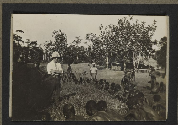
Les femmes de Liki