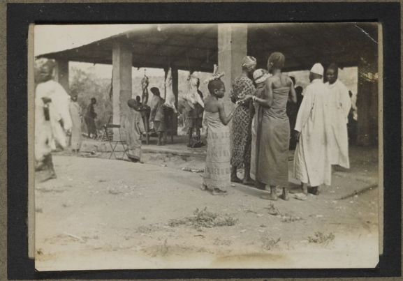
Marché de Kilosa