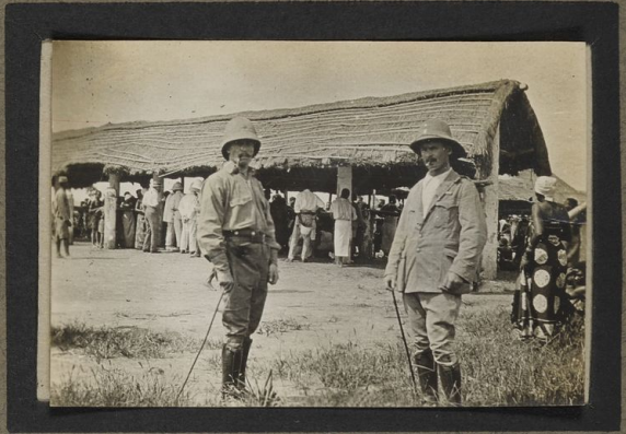
Marché à Kongolo