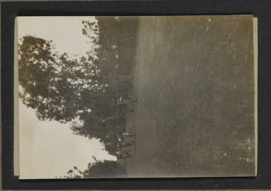
Une vue à Kissimui 25 - 12 - 1916