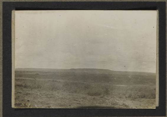
Plaine de la Malagarassi