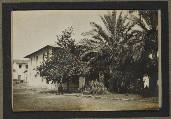
La forteresse d'Udjidji & a a Le 3. 8. 1918.