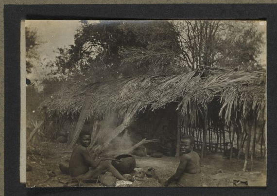
Hutte indigène Vers Kaporo E.H.