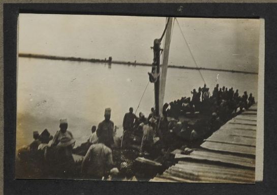
Une barge sur le fleuve Congo