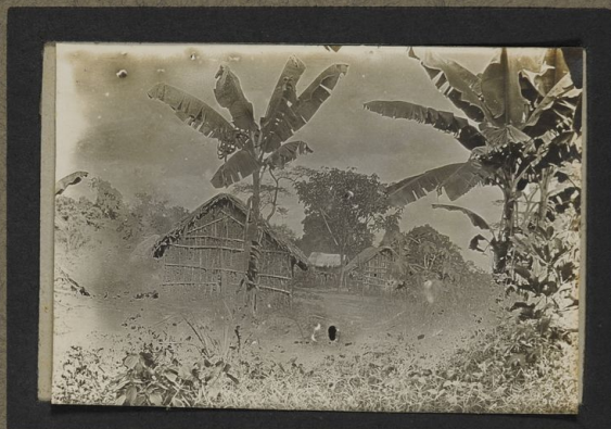
Village indigène (Danza)