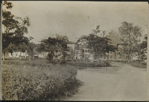
L'hôpital de Dar Es Salaam