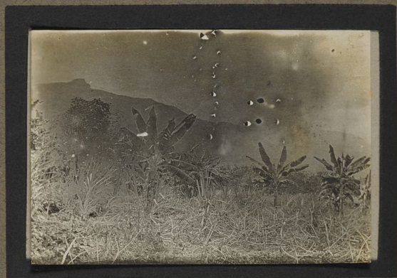
Culture de bananes