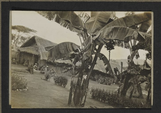
Hopital indigène (Kilosa)