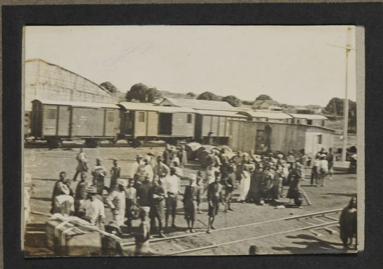
Les indigènes de Tugoma en admiration devant le Barre Danhu