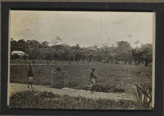
Jardins de Kinshasa