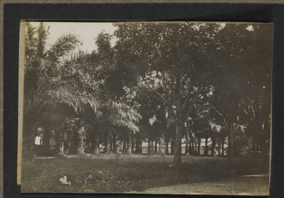
Le parc de Stanleyville