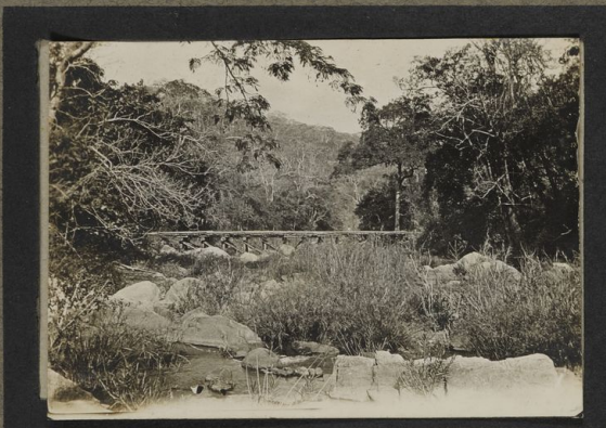
Pont vers Mahangé