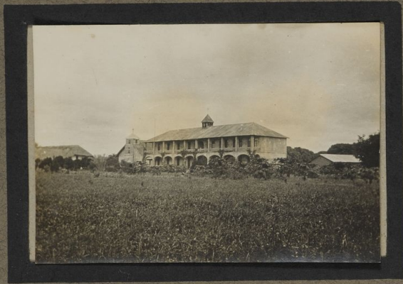
La Mission de Tabora & a a Le 2. 5. 1917