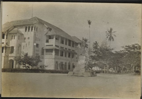
La grande Place de Dar Es Salaam Le 15-11-1918