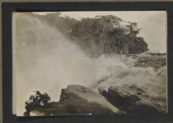
Chutes de la T'chofo