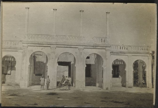
Palais du Gouverneur E. A. A. Démoli par les navires Anglais