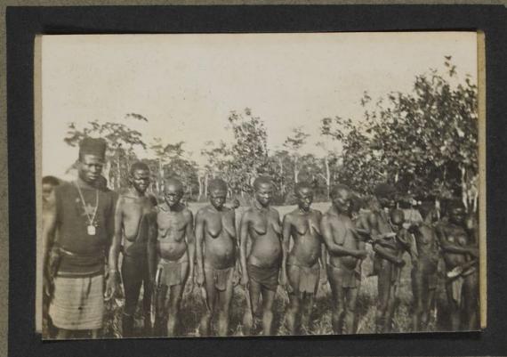
Beautés indigènes des rives du Lemani C.B.