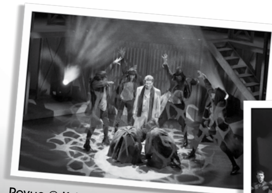
Revue © K. Leleux I. De Beir