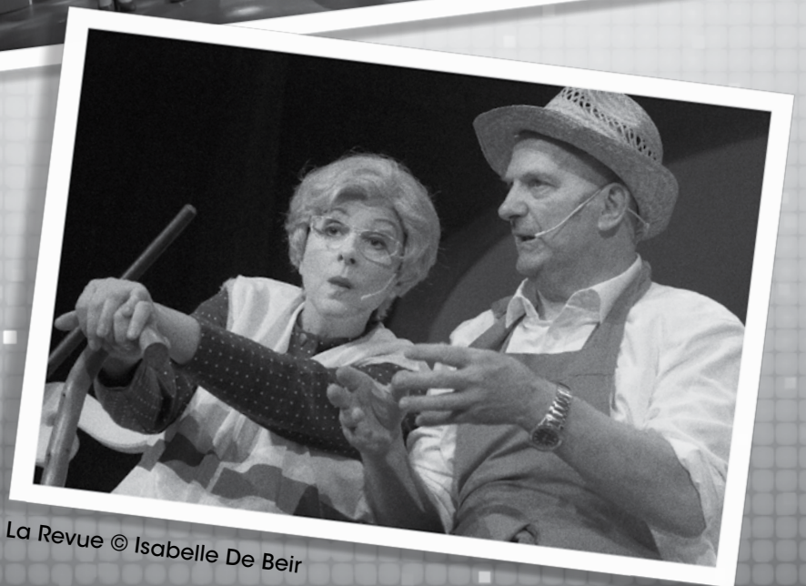
La Revue © Isabelle De Beir