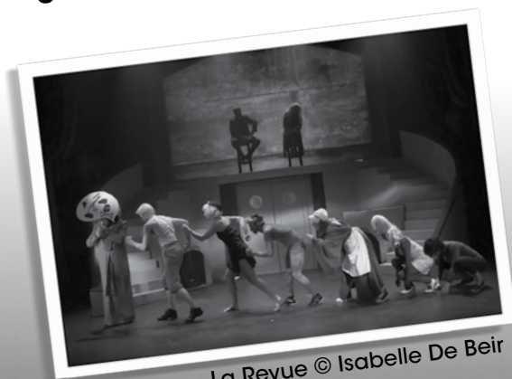
La Revue