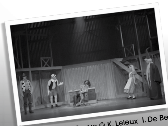
Revue © K. Leleux I. De Beir