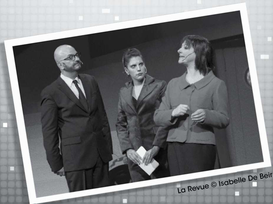
La Revue