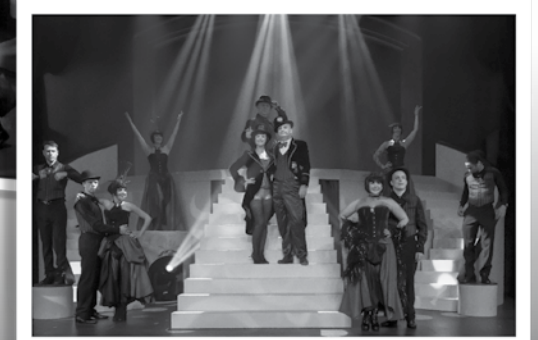
La Revue