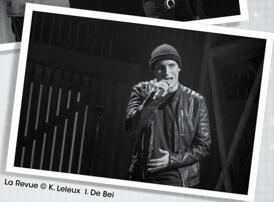
La Revue © K. Leleux I. De Bei