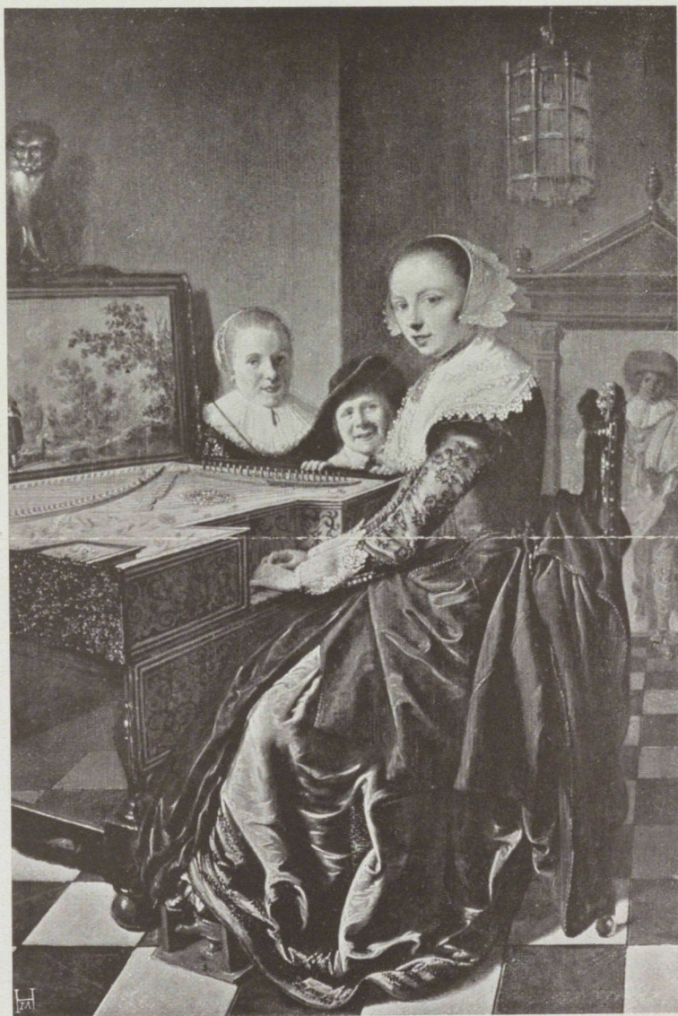
„La dame au clavecin“ par Jan M. Molenaer (1600—1668). Musée de l'Etat, Amsterdam. — 496