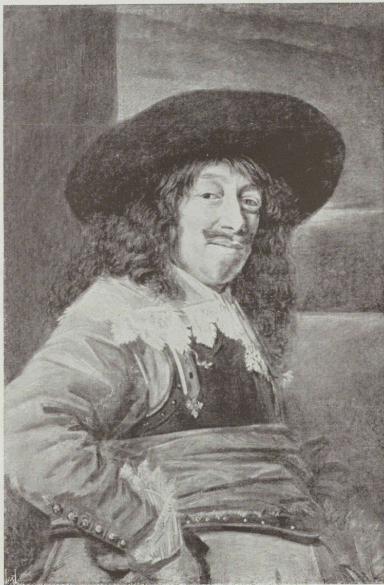
„Portrait d'un amiral“ par Frans Hals le Vieux (1580—1666). Ermitage, St. Petersburg. — 550