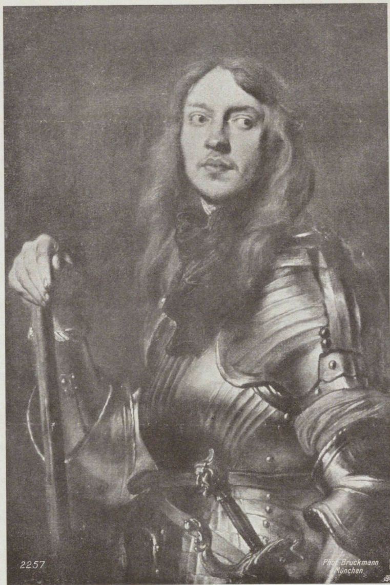
„Portrait d'un général“ par A. van Dyck (1599—1641). Galerie Royale, Dresde. — 2257