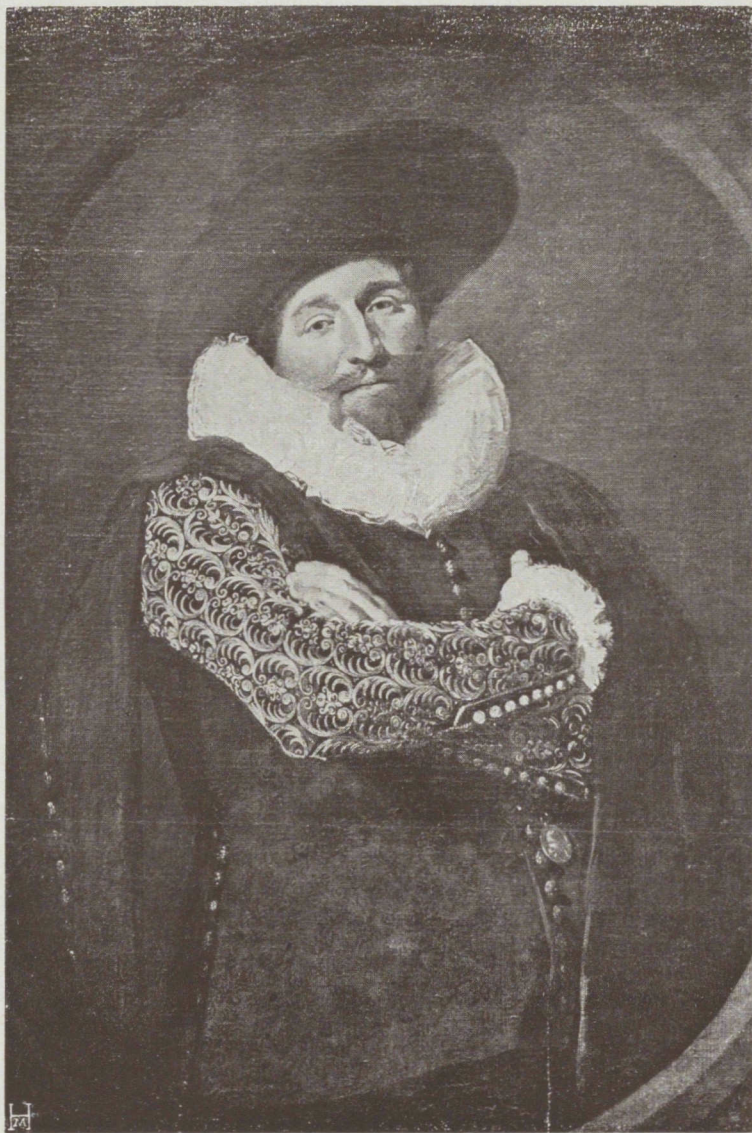
„Portrait d'homme“ par Frans Hals le Vieux (1580—1666). Galerie Devonshire, Londres. — 730