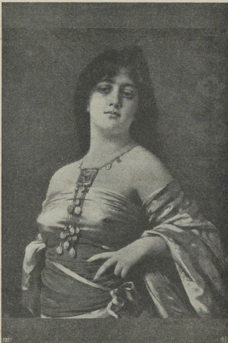
„Favorite“ par N. Sichel. Photogr. Union, Munich. — 2857