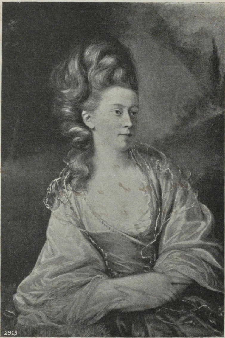
„Portrait“ par John S. Copley (1737—1815).