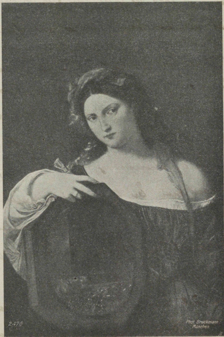
„La vanité“ par le Titien (1477—1576). Pinacothèque, Munich. — 2476