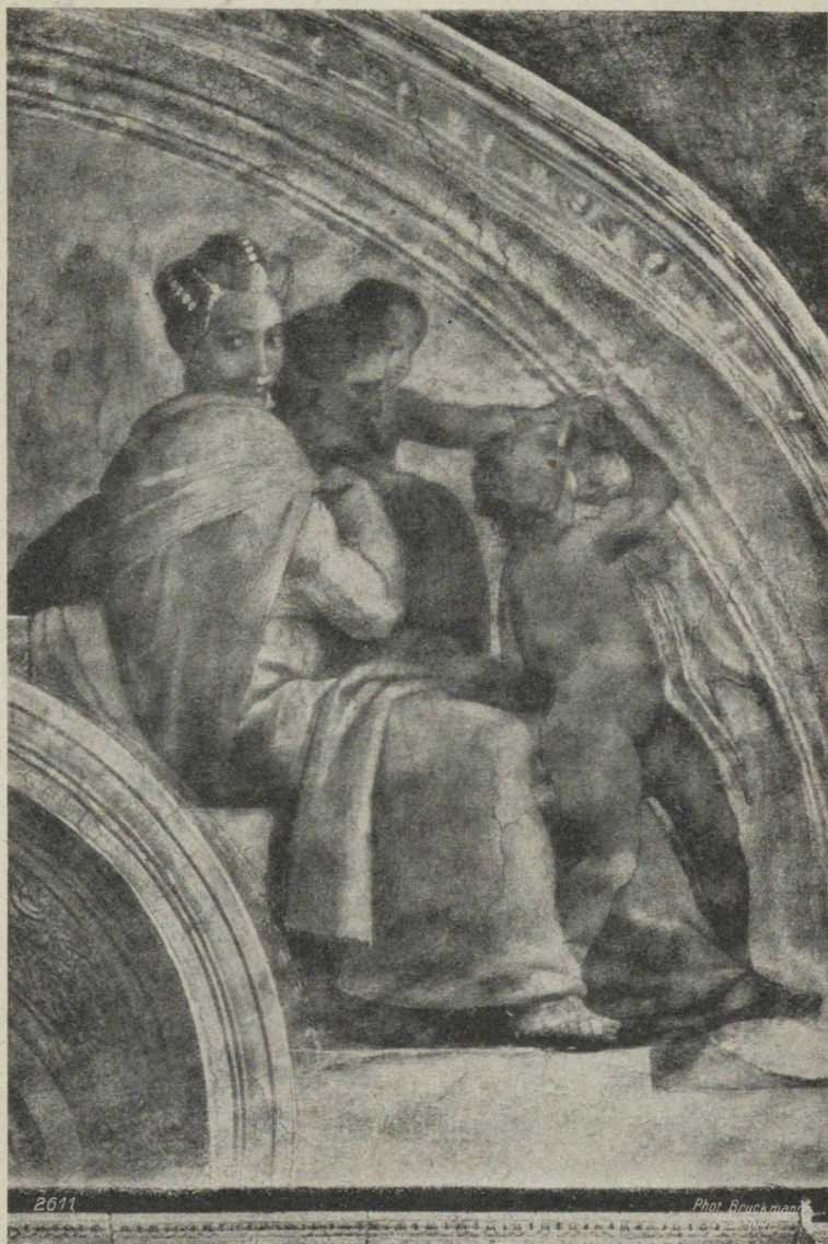
„Lunette Jacob-Joseph“ par Michel-Ange (1475—1564). (Partie droite). Chapelle Sixtine, Rome. — 2611