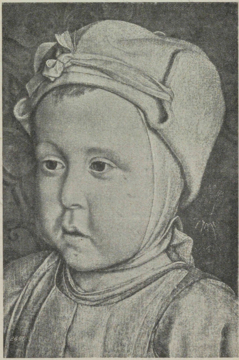
„Dauphin Charles Orlant“ par Jean Bourdichon.