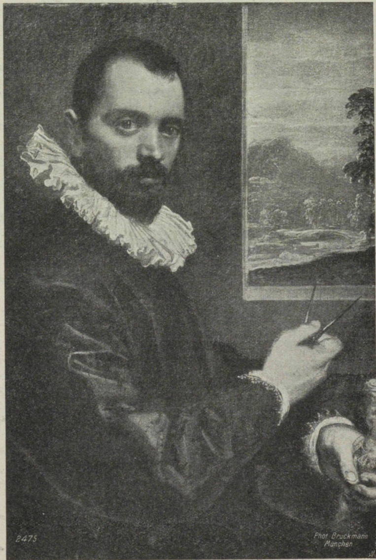
„Portrait d'Andreas Vesalius“ par Jacopo Robusti le Tintoret (1518—1594). Pinacothèque, Munich. — 2475