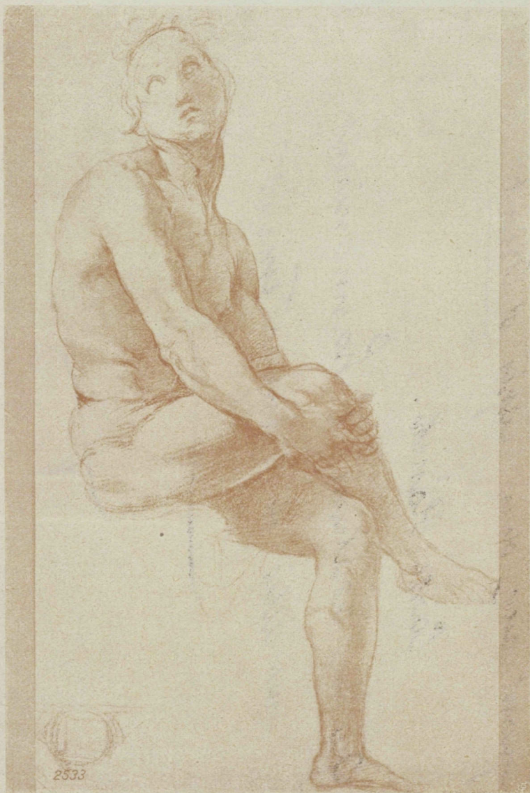
„Esquisse“ par Raphaël (1483—1520). Galerie Uffizi, Florence. — 2533