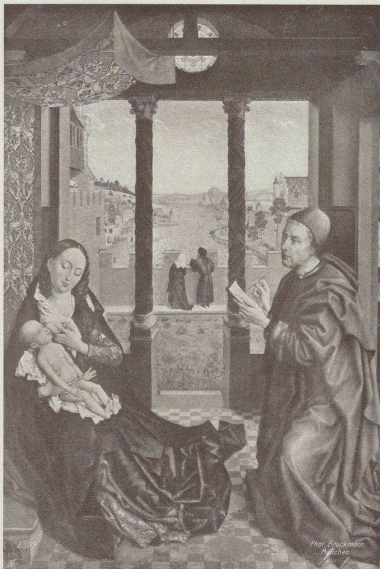
„L'évangéliste Luc dessinant la Vierge“ par Roger van der Weyden (1399—1464), Pinacothèque, Munich. — 2399