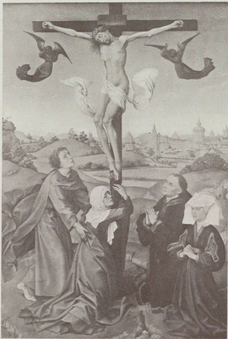
„Tableau d'Autel“ par Roger van der Weyden (1399—1464).