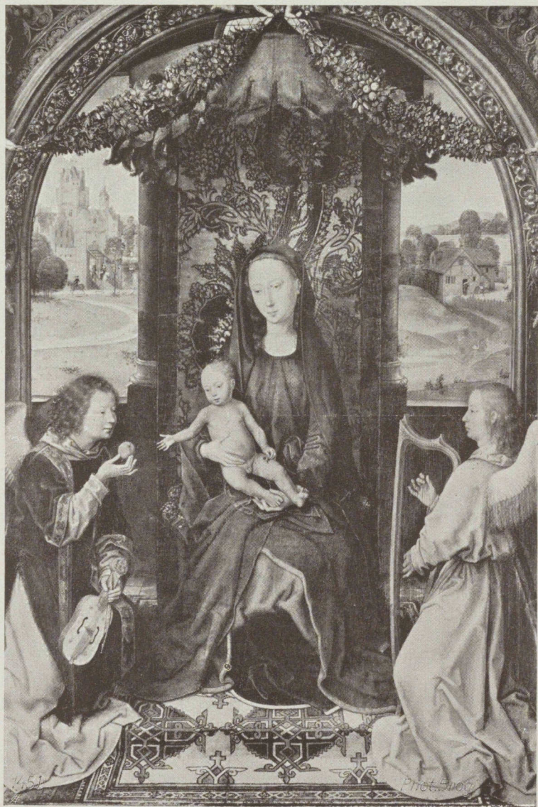
„La Vierge et l'Enfant“ par H. Memling (1430—1495).