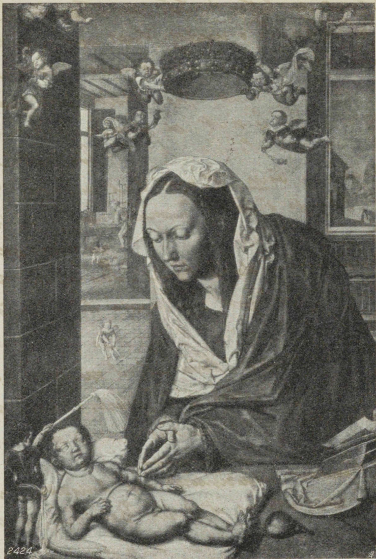
„La Vierge avec l'Enfant“ par Albrecht Dürer (1471—1528).