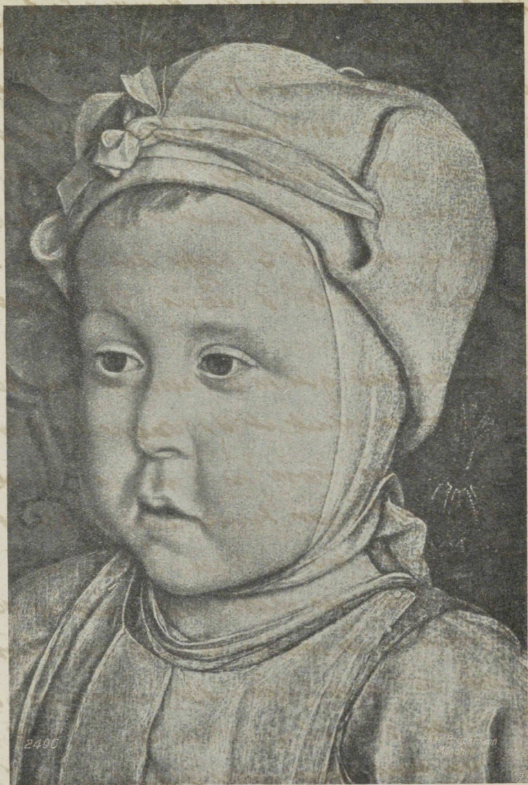
„Dauphin Charles Orlant“ par Jean Bourdichon.