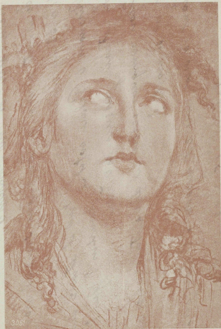
„Tête d'étude“ par E. L. Le Brun (1755—1842). Pas assez admiré - Vienne, Albertina.