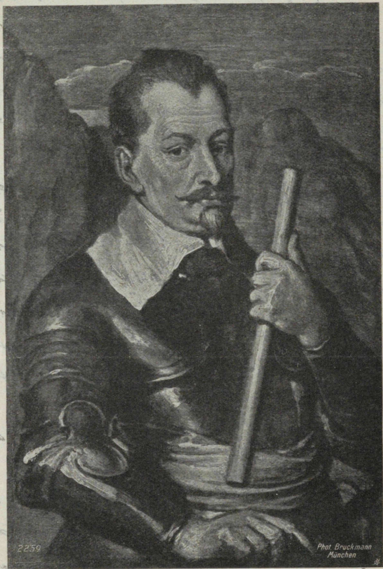
„Albrecht von Wallenstein“ par A. van Dyck (1599—1641). Pinacothèque, Munich. — 2259