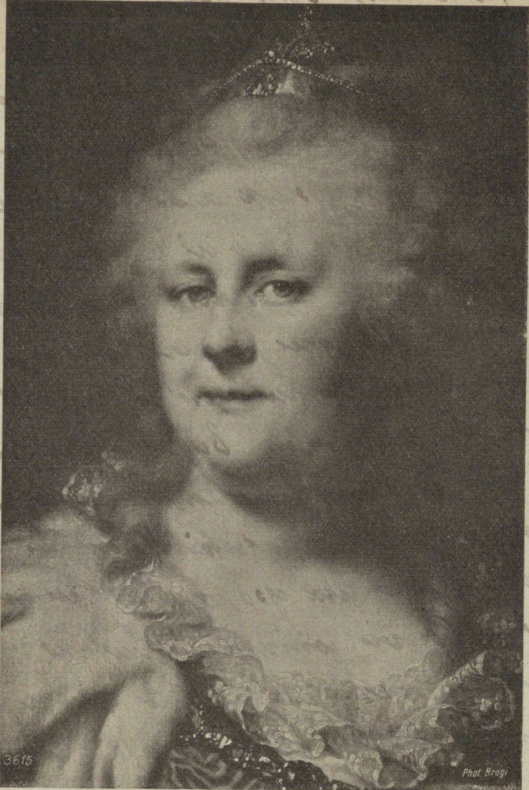
„L'Imperatrice Cathérine II.“ par G. B. Lampi (1751—1830). Petersbourg, Palais imperiale. — 3615