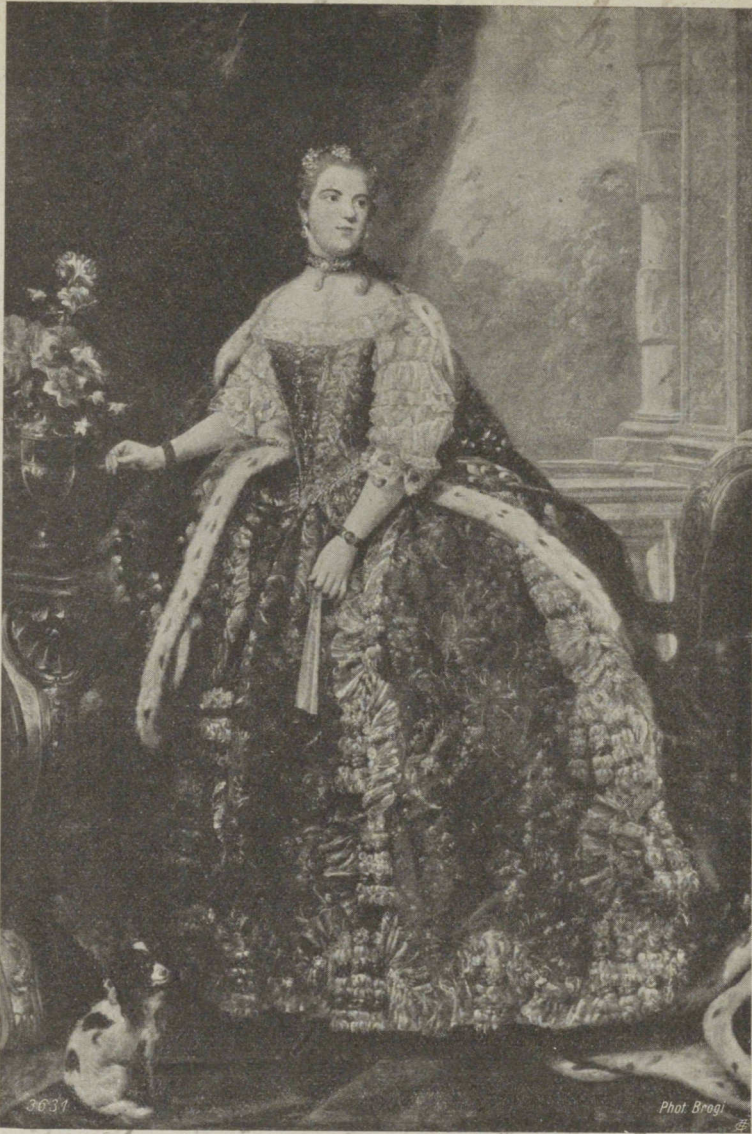
„Elisabeth de France“ par L. Pecheux. Parma, Pinacothèque. — 3631