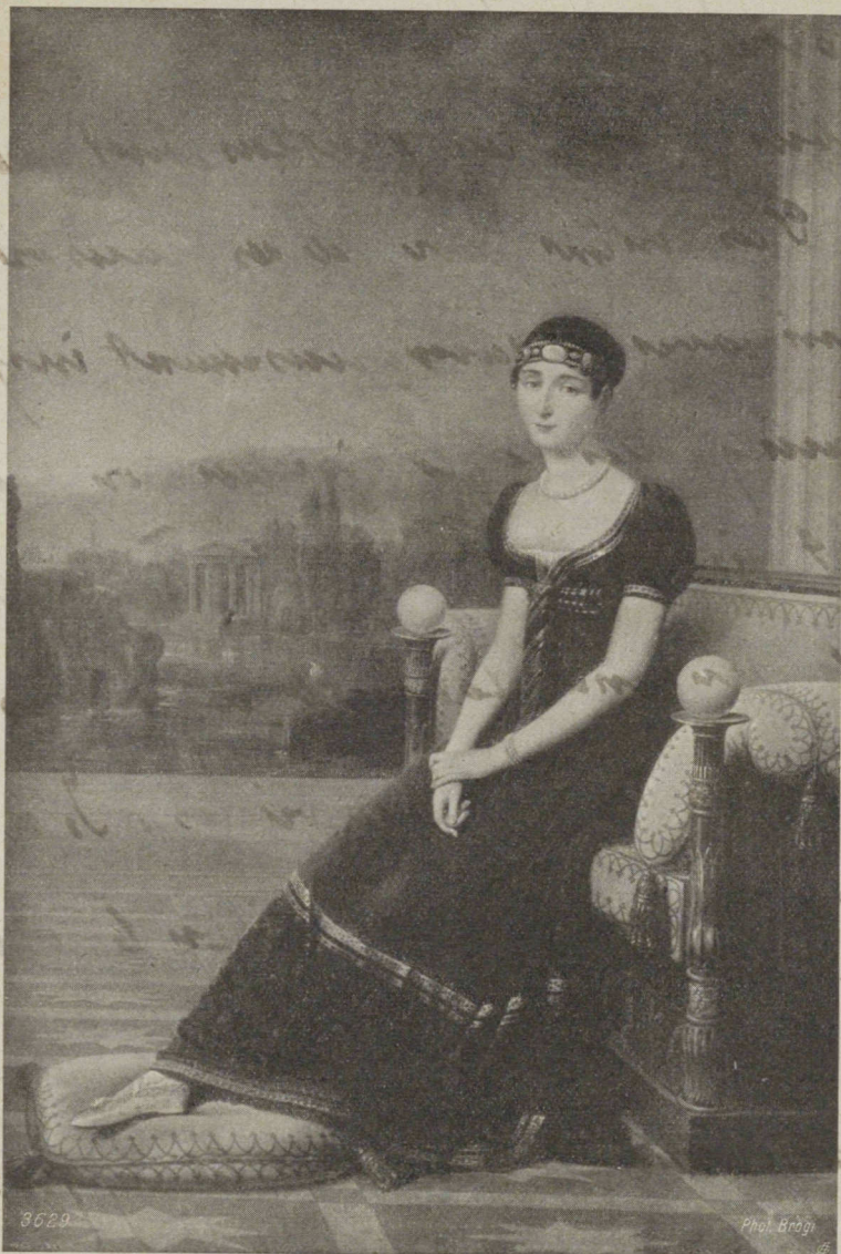
Pauline Bonaparte-Borghese" par F. G. Kinson.