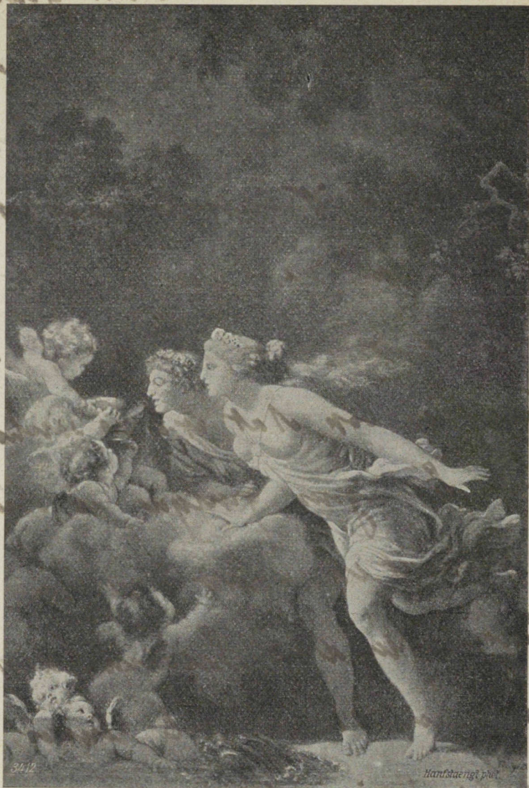
„Fontaine d'Amour“ par J. H. Fragonard (1732—1806). Londres, Collection Wallace. — 3412