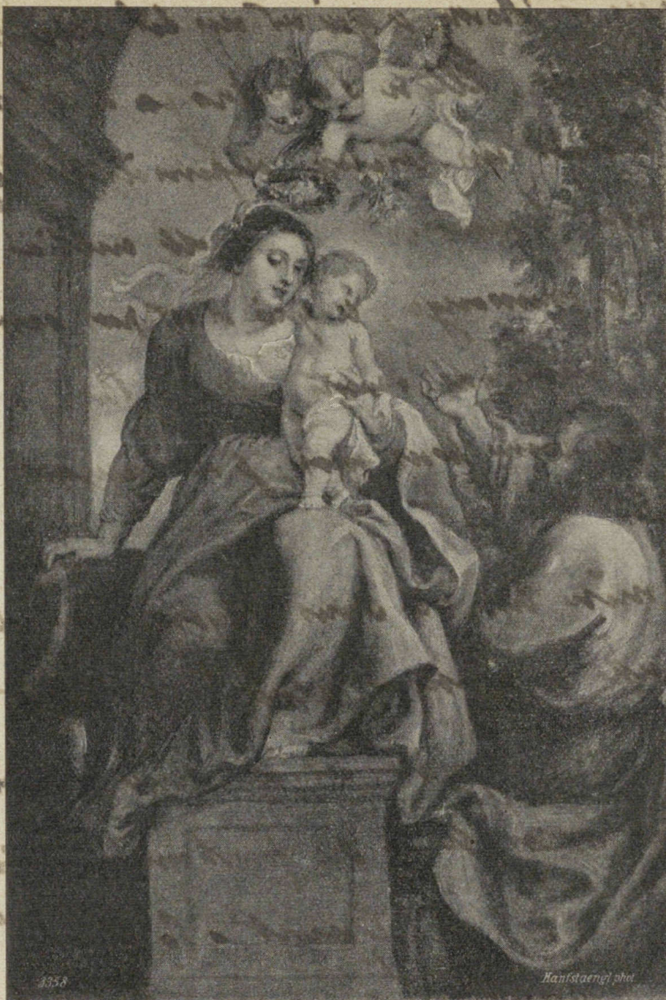
„La Sainte Famille avec les anges“ par P. P. Rubens (1577—1640). Madrid, Prado — 3358