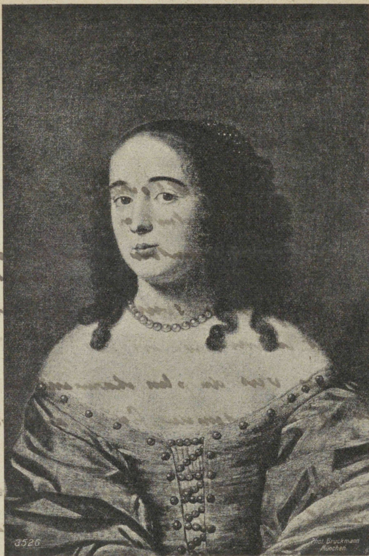
„Ninon de l'Enclos“ par P. Mignard (1612—1695). Bruxelles, Musée. — 3526