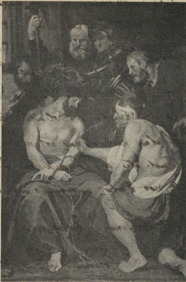
„Jésus couronné d'épines“ par A. van Dyck (1599—1641). Madrid, Prado. — 3366