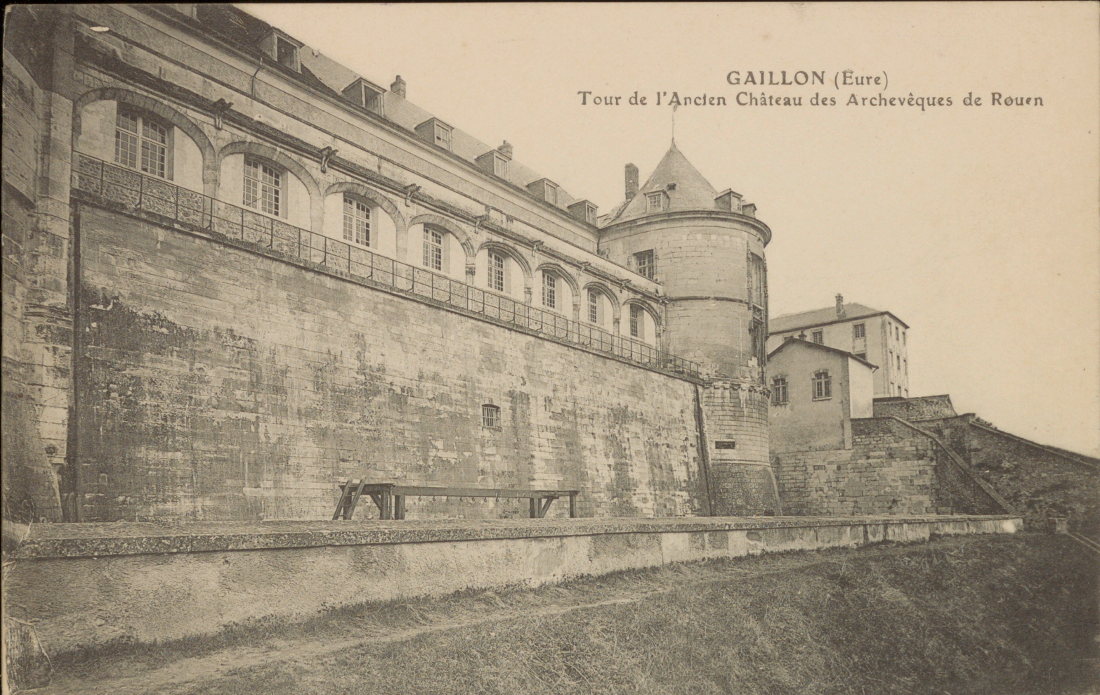
GAILLON (Eure) Tour de l'Ancien Château des Archevêques de Rouen