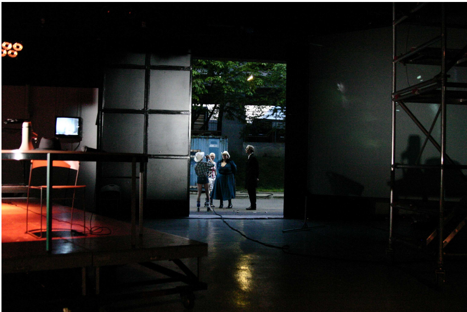
life is but a dream #1 —Festival 100 dessus dessous, Paris, 13-14 avril 2007