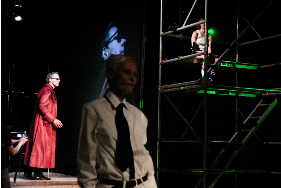
© Juliette Dieudonné / life is but a dream #1 —Festival 100 dessus dessous, Paris, 13-14 avril 2007