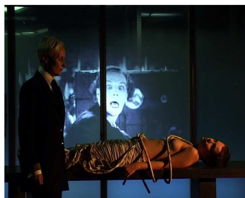
© Guillaume Robert / extrait de Projet pour une nouvelle révolution à New York

Cela se traduit par la rencontre du temps de la représentation avec le temps filmique, façon d'envisager nouvellement la temporalité de la représentation théâtrale, ainsi que la relation entre langage et pensée. Cette réinvention semble nécessaire et requise pour s'approcher des sensations et innovations du texte de Kathy Acker.