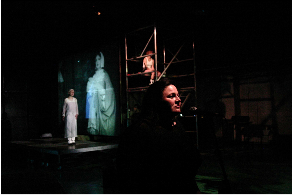
© Juliette Dieudonné / life is but a dream #1 —Festival 100 dessus dessous, Paris, 13-14 avril 2007