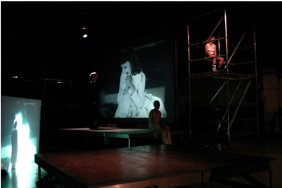
© Juliette Dieudonné / life is but a dream #1 —Festival 100 dessus dessous, Paris, 13-14 avril 2007