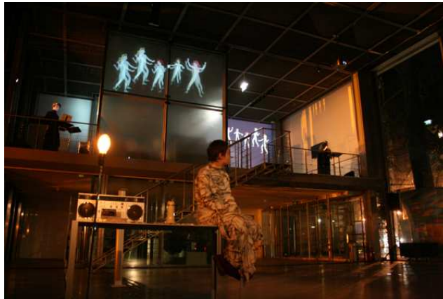
© Julien Tinne / Performance à La Fondation Cartier—11 janvier 2007

L'espace scénique doit être en mutation constante; le temps filmique est véritablement processuel, grâce à une construction interactive en tant réel.