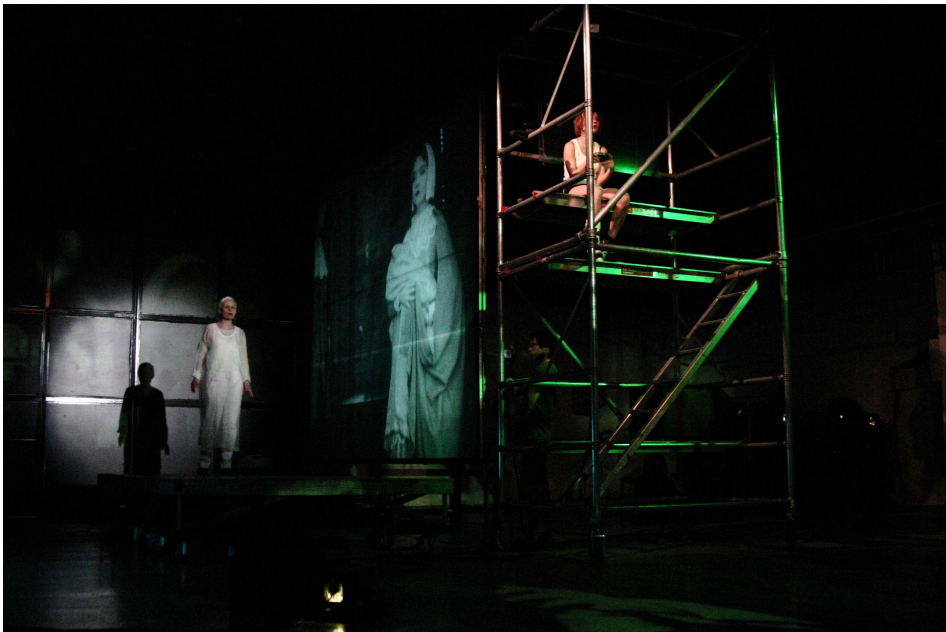
© Juliette Dieudonné / life is but a dream #1 —Festival 100 dessus dessous, Paris, 13-14 avril 2007