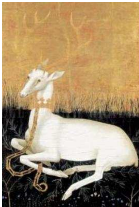
Cerf Blanc, symbole de Richard II – The Wilton diptyc