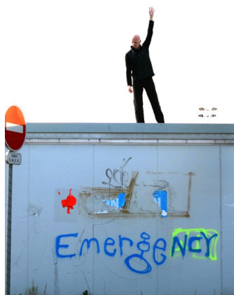
◀ Solo 30x30, Nancy