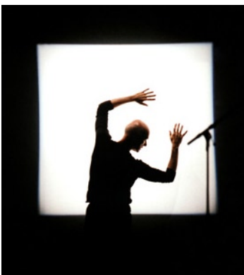
▲ Solo 1x60 - Un jardin d'objets