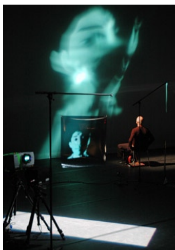
▲ Solo 1x60 - Un jardin d'objets