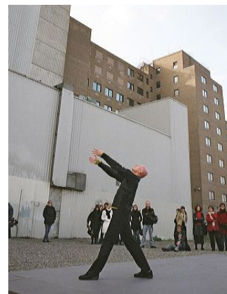
▲ Solo 30x30, Montr al