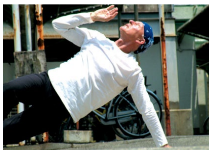
▲ Solo 30x30, Yamaguchi