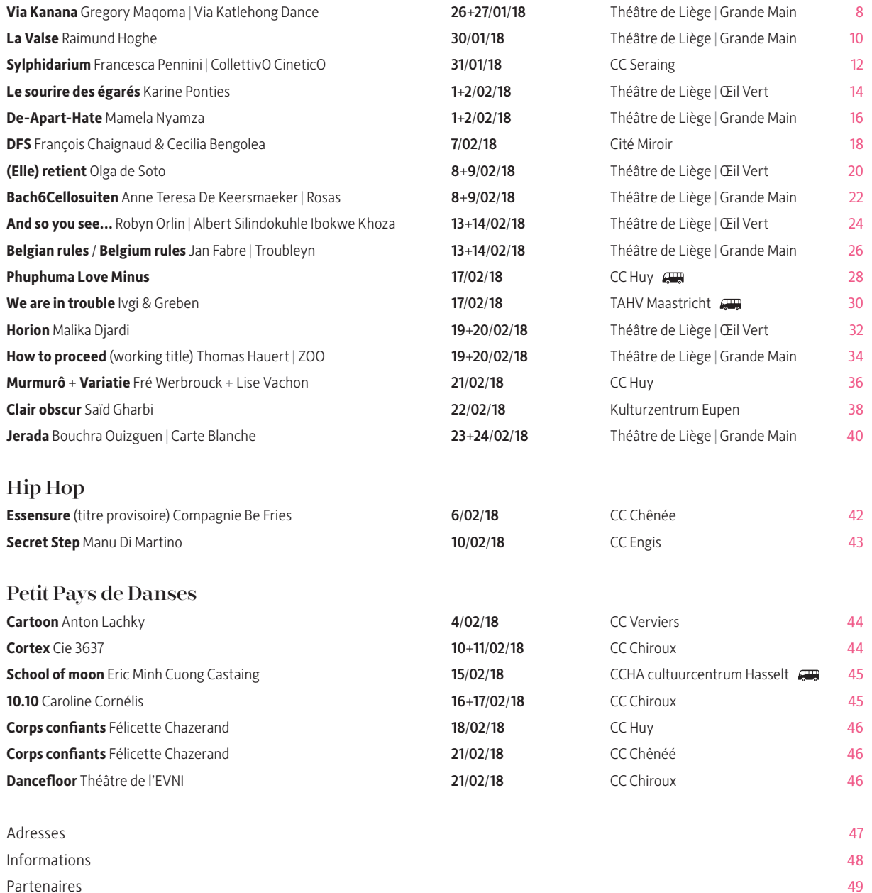
Table des matières Inhoud / Contents