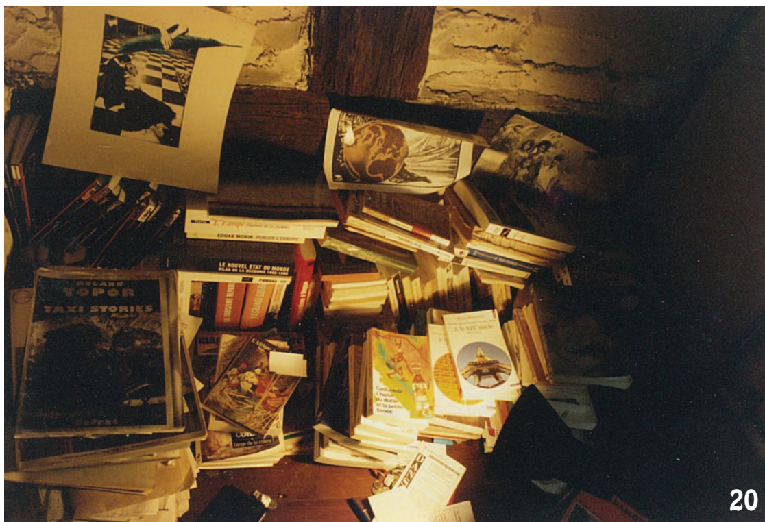
Photo 19 : Retour aux sources, chez Raymond, son père, à Tucuman au nord est de l' Argentine dans les années 90. Photo 20 : Un coin d'une chambre en Roture en 1992.