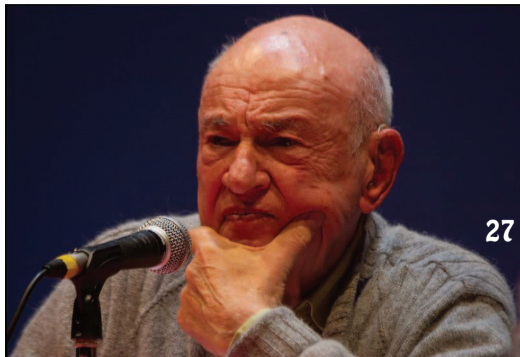
Photo 25 : René Girard Photo 26 : Michel Serres Photo 27 : Edgard Morin