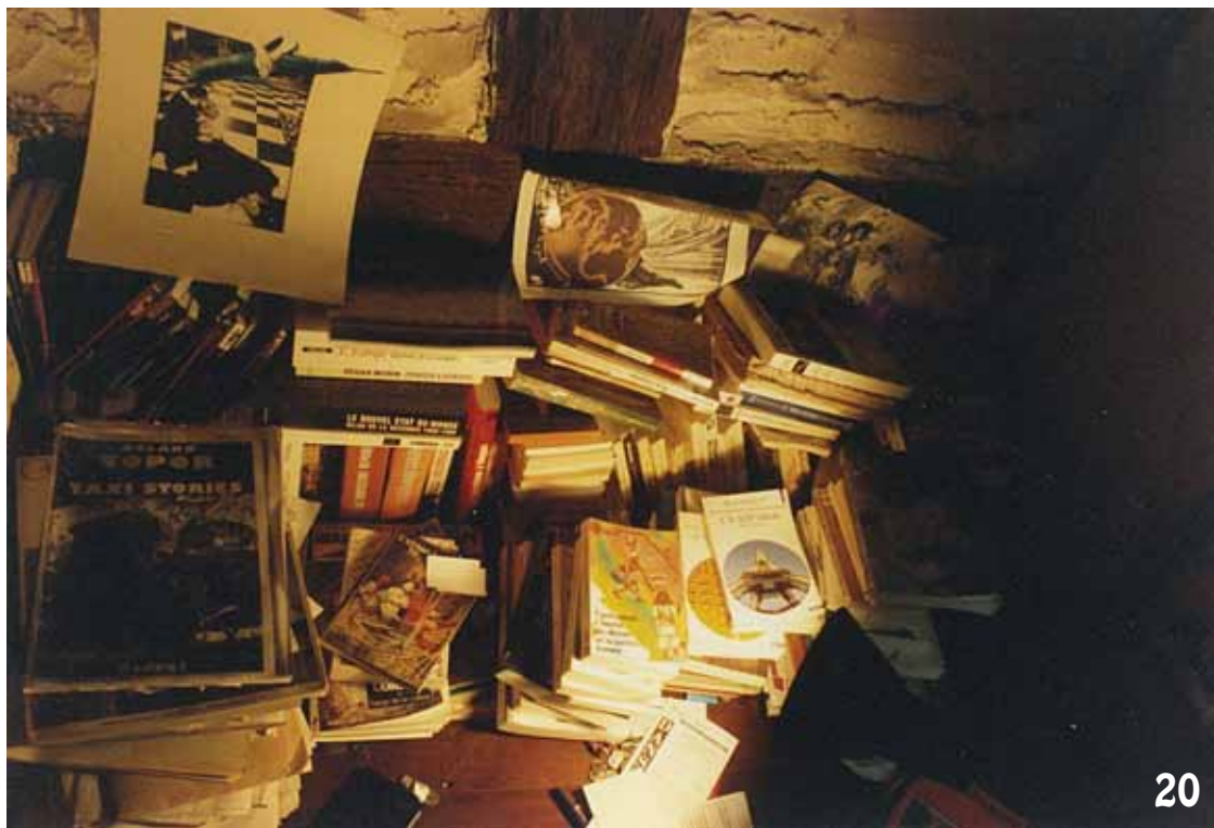
Photo 19 : Retour aux sources, chez Raymond, son père, à Tucuman au nord est de l' Argentine dans les années 90. Photo 20 : Un coin d'une chambre en Roture en 1992.