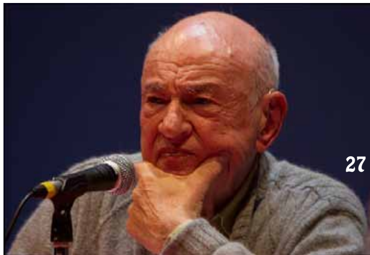
Photo 25 : René Girard Photo 26 : Michel Serres Photo 27 : Edgard Morin