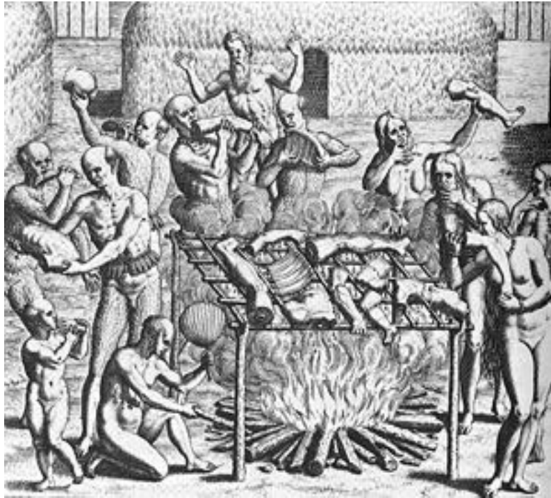
Cannibalisme au Brésil en 1557, décrit par Hans Staden