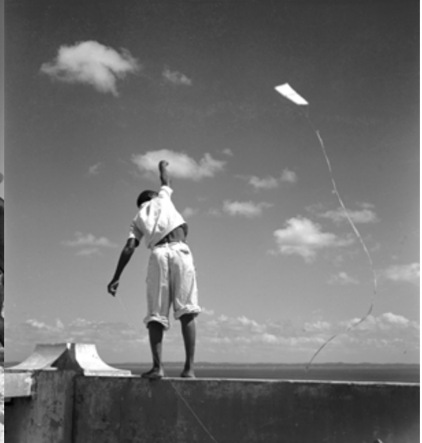
Salvador - Brésil, 1946 - 1978